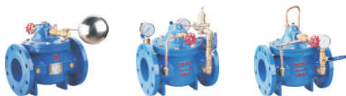
1601 遥控浮球阀 1602 减压稳压阀 1603 缓闭式止回阀