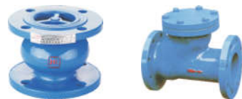
1401 消声止回阀 1406 滑动滚式止回阀