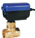
768X电动两通阀 (三线连接)