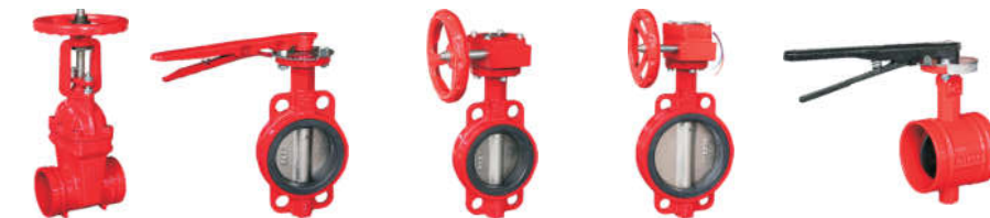
1196 消防闸阀 (沟槽明杆) 1591 消防蝶阀 (对夹手柄) 1592 消防蝶阀 (对夹涡轮) 1593 消防信号蝶阀 (对夹信号) 1594 消防蝶阀 (沟槽手柄)