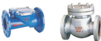
1403 橡胶瓣止回阀 3401 旋启式止回阀