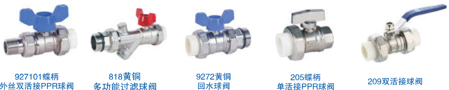
927101 蝶柄 外丝双活接PPR球阀