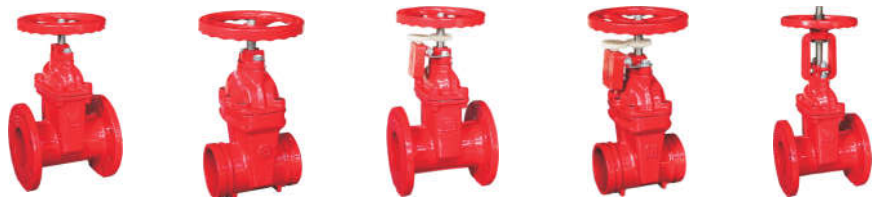
1191 消防闸阀 (法兰暗杆) 1192 消防闸阀 (沟槽暗杆) 1193 消防信号闸阀 (法兰信号) 1194 消防信号闸阀 (沟槽信号) 1195 消防闸阀 (法兰明杆)