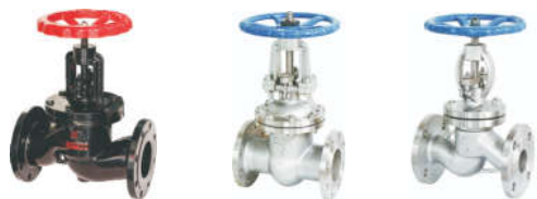
1301 铸铁截止阀 3101 铸钢硬密封闸阀 3301 铸钢截止阀