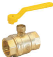
R50001黄铜内螺纹锁式球阀