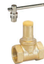
316黄铜 锁式止回截止阀