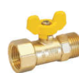
207黄铜内外丝燃气球阀