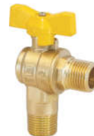
R30401黄铜外螺纹直角球阀