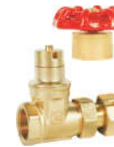
911401黄铜 表前磁性闸阀