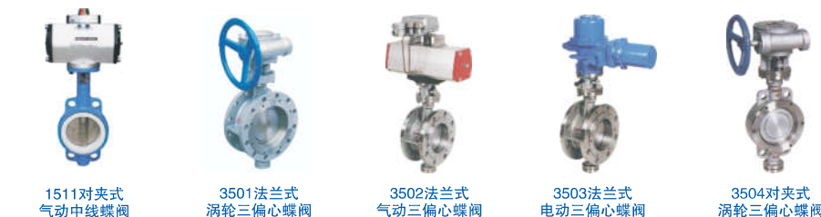
1511对夹式 气动中线蝶阀