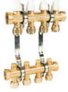
631一体式 调节型分水器