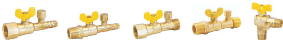
R10001 黄铜 内直嘴测压球阀