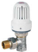
371角式自动 温控阀 (高阻尼)