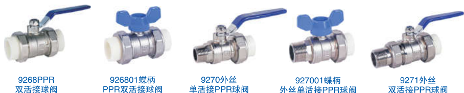
9268 PPR 双活接球阀