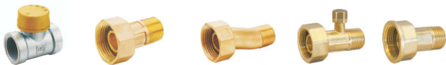
TF-300 防拆 异径三通