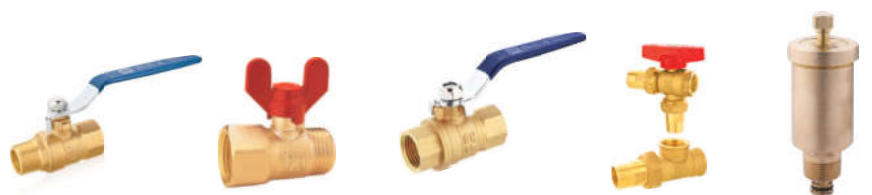
251黄铜 内外螺纹球阀