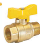
248黄铜内外螺纹燃气球阀