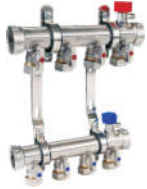
630一体式 球阀型分水器