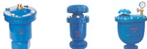
1705 单口排气阀 1801 复合式快速排(进)气阀 1802 复合式排气阀