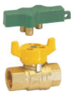
9200A黄铜双控防盗燃气球阀