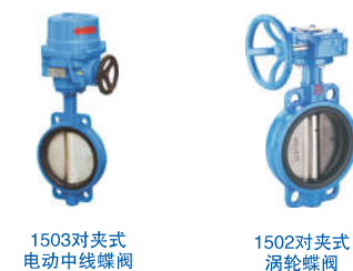
1503对夹式 电动中线蝶阀