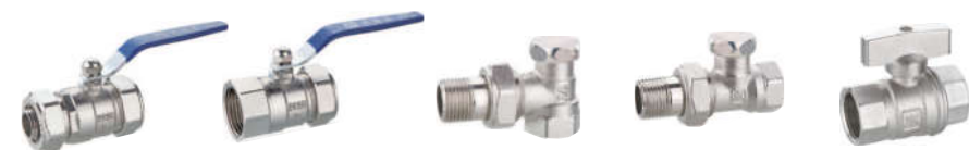
274黄铜 双头卡套球阀