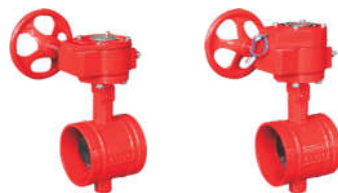
1595 消防蝶阀 (沟槽涡轮) 1596 消防信号蝶阀 (沟槽信号)