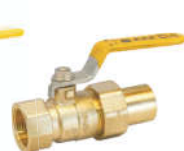
R60101黄铜异径活接球阀