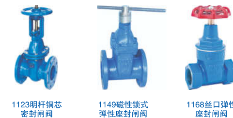
1123明杆铜芯 密封闸阀