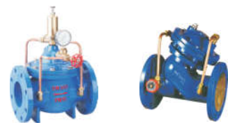
1605 持压泄压阀 1609 多功能水泵控制阀