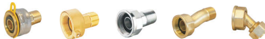
TF-901 黄铜 防盗燃气表接头