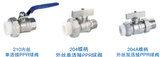
210 内丝 单活接PPR球阀