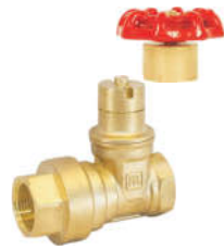
9168黄铜磁性锁式止回闸阀