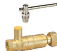
278黄铜表 前锁式止回球阀