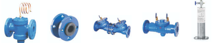
1805 自力式压差控制阀 1806 橡胶软接头 1807 防污隔断阀 1808 倒流防止器 1809 水锤吸纳器