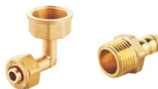
T210 黄铜铝塑管 90° 燃气接头