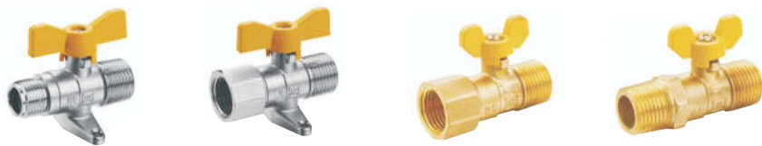
R10201 黄铜 外螺纹带底座球阀