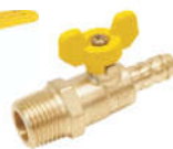
R11041黄铜外螺纹燃气直嘴