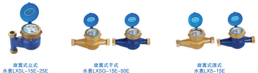
旋翼式立式 水表 LXSL-15E-25E