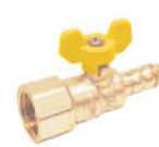
R11402黄铜内螺纹燃气直嘴