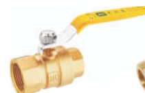
242黄铜异径内螺纹燃气球阀