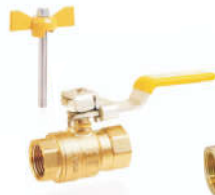
R50501黄铜可控内螺纹球阀