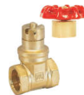
9119黄铜 磁性锁式闸阀