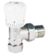
377角式 铝塑管手动温控阀