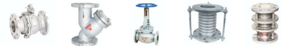
3210 法兰球阀 3606 铸钢过滤器 3801 KPF 平衡阀 1808 倒流防止器 3807 限位伸缩器