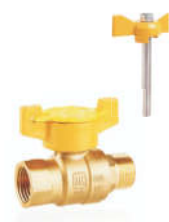
R50602黄铜内外丝防盗球阀