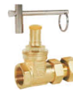
9108黄铜锁式 伸缩闸阀